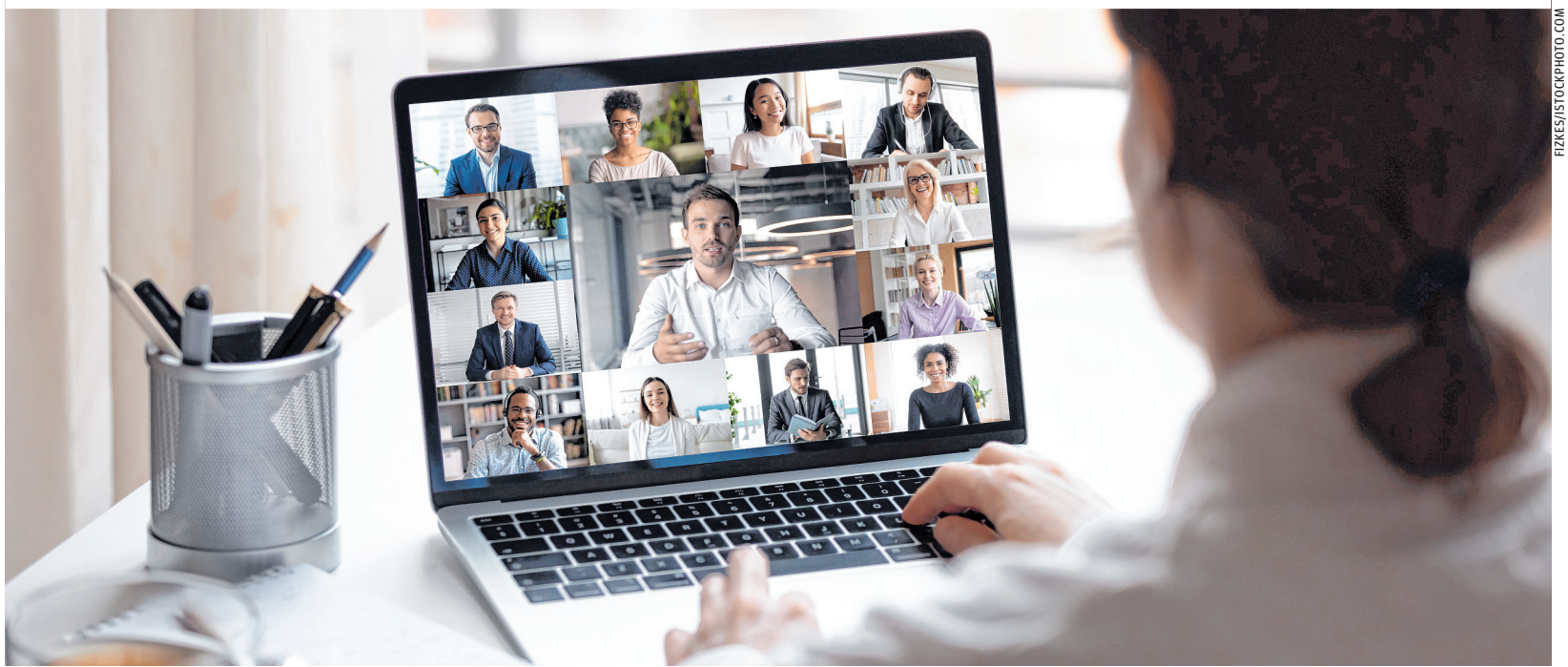
Homeoffice - seit Corona eine Selbstverständlichkeit. Auch Arbeitswelten erfinden sich ständig neu, die Gesellschaft muss darauf reagieren