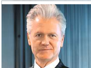
HDI LEBEN/INGO FOLIE

Im nächsten KURIER-Schwerpunktthema am 12. April geht es um die Auswirkungen der Corona-Krise auf unser Gesellschaftssystem.