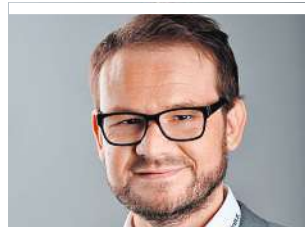
VEREIN CHRONISCH KRANK

Viele der rund 66.000 Beschäftigten in der 24-Stunden-Pflege kommen aus dem Ausland. Die rigorosen Grenzkontrollen und Quarantänevorschriften haben